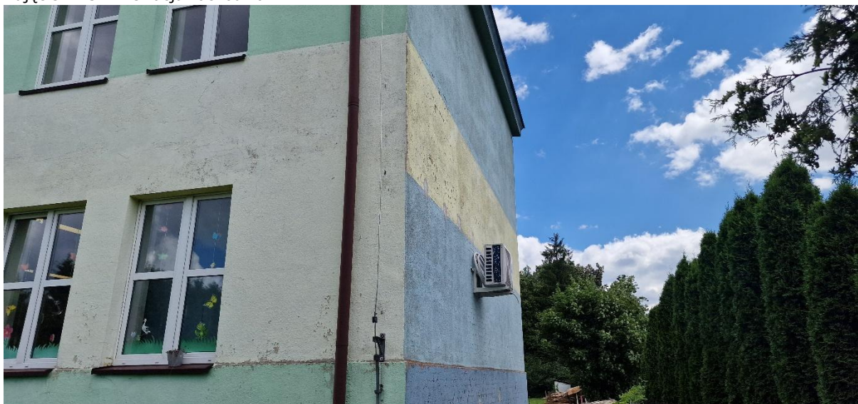
Zdjęcie Nr 6 – Elewacja południowa.