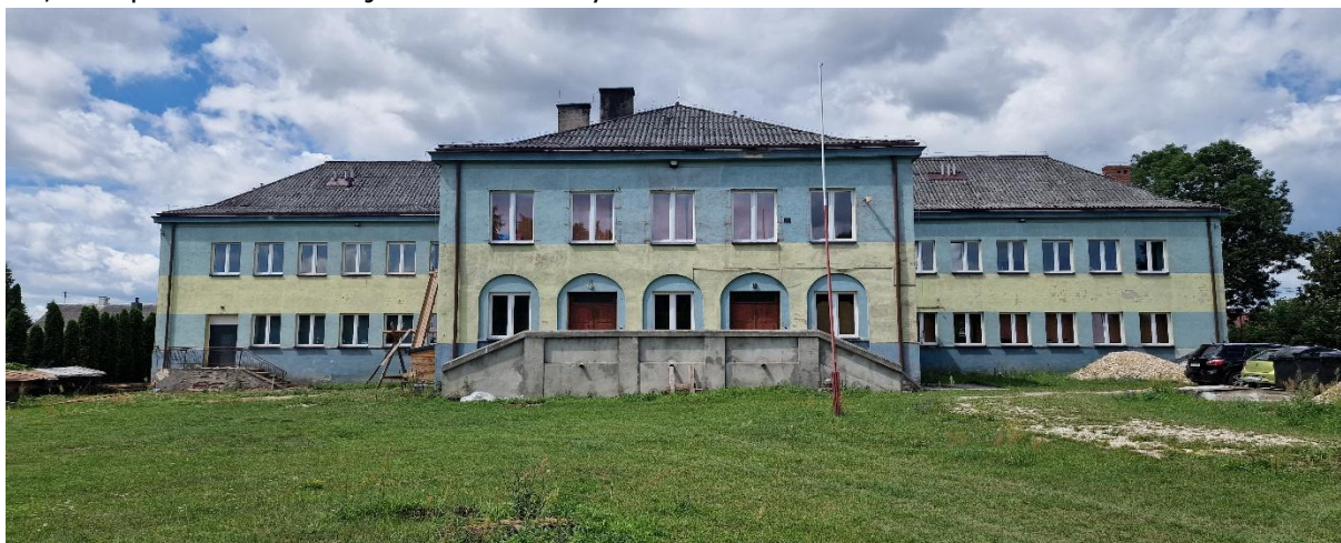
Zdjęcie Nr 1 – Elewacja wschodnia.