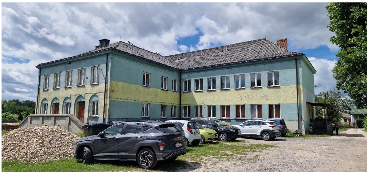
Zdjęcie Nr 2 – Elewacja północno - wschodnia.