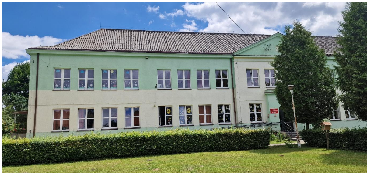
Zdjęcie Nr 5 – Elewacja zachodnia.